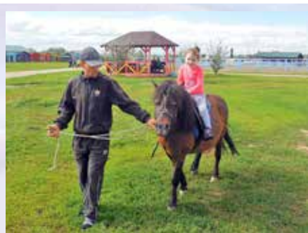
Подготовила Галина Дрозденко

есть отличная игровая комната и детская площадка. Чистый бассейн. Понравилась живописная природа, воздух и богатый животный мир Алтая. Много туристических маршрутов и экскурсий. У нас остались самые благоприятные впечатления от отдыха, и мы с семьей собираемся еще не раз там побывать.