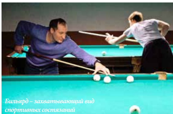
Бильярд – захватывающий вид спортивных состязаний

В преддверии 8 Марта хочу поздравить прекрасную половину завода с праздником весны, красоты и тепла. В этот день мы ещё раз говорим нашим женщинам насколько они прекрасны, добры, очаровательны. Вы – наш очаг и опора, вы наполняете жизнь смыслом и вдохновляете на созидательный труд. Спасибо вам за всё!