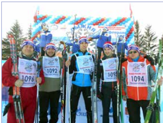
Заводчане на «Лыжне России»

Крутые повороты, склоны или подъемы трассы не пугали отважных лыжников. Гонка проходила достаточно динамично и эмоционально: азарт и задор гонщиков, слезы от радости победы или горечи поражения. С разными результатами к финишу пришли все участники забега. По итогам соревнований победителям и призёрам были вручены заслуженные награды.