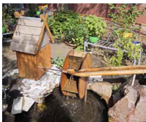
Водяная мельница электроучастка цеха № 63

В новой номинации «Уголок чудес – Году экологии» особенно порадовали сделанные из старых покрышек и пластиковых бутылок лебедь, черепашка, бегемотик и ландыши на участке 61-го цеха, а также сказочный петух, сделанный из старых резиновых покрышек, на ухоженной территории цеха № 65. Жюри надеется, что в данной номинации ещё найдутся энтузиасты из других подразделений и присоединятся к конкурсу.