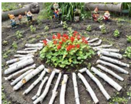
«Костёр» 10-го цеха

отдохнуть на скамейке-качеле, наблюдая за бьющими из фонтана струйками воды. Необычно, в виде костра, оформили цветник конкурсанты 10-го цеха. В очередной раз приятно шокировали членов жюри работники электроучастка цеха № 63! В дополнение к обновленной водяной мельнице и новым элементам оформления они соорудили маленький искусственный пруд, в котором плавают настоящие караси.