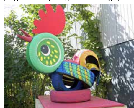
65-й цех – Году экологии

В новой номинации «Уголок чудес – Году экологии» особенно порадовали сделанные из старых покрышек и пластиковых бутылок лебедь, черепашка, бегемотик и ландыши на участке 61-го цеха, а также сказочный петух, сделанный из старых резиновых покрышек, на ухоженной территории цеха № 65. Жюри надеется, что в данной номинации ещё найдутся энтузиасты из других подразделений и присоединятся к конкурсу.