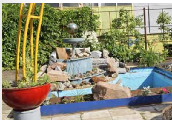
Фонтан 63-го цеха