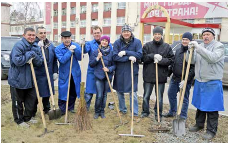
На заводском субботнике