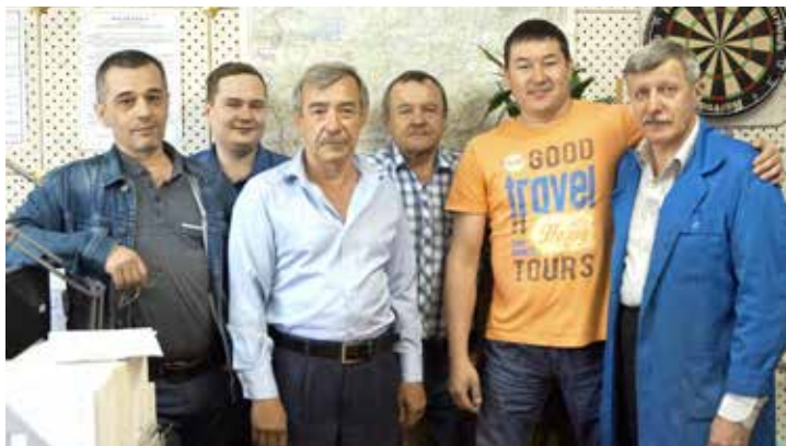
Отдел информационных систем