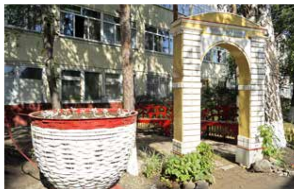
Зона отдыха механообрабатывающего производства