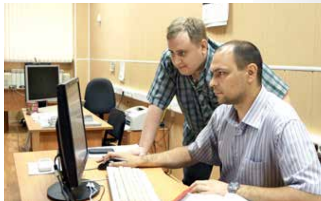
Сотрудники отдела корпоративных информационных систем за работой

варного выпуска, плана, зарплаты и т.д. Делаем все, дорабатываем программы своими силами, не обращаемся в аутсорсинг. Так, в отделе автоматизированных систем управления производством разработаны программы для складского учета, бухгалтерии, финансового отдела, производства, сбыта, снабжения. С помощью этих программ накоплены базы данных, в которых хранятся сотни тысяч записей, с ними работают десятки специалистов практически всех заводских служб. Производственники берут у нас данные по необходимому выпуску продукции. ОАСУП, исходя из требований планово-диспетчерского отдела, считает также ежемесячный производственный план.