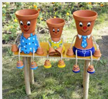
На участке СМП

отдохнуть на скамейке-качеле, наблюдая за бьющими из фонтана струйками воды. Необычно, в виде костра, оформили цветник конкурсанты 10-го цеха. В очередной раз приятно шокировали членов жюри работники электроучастка цеха № 63! В дополнение к обновленной водяной мельнице и новым элементам оформления они соорудили маленький искусственный пруд, в котором плавают настоящие караси.