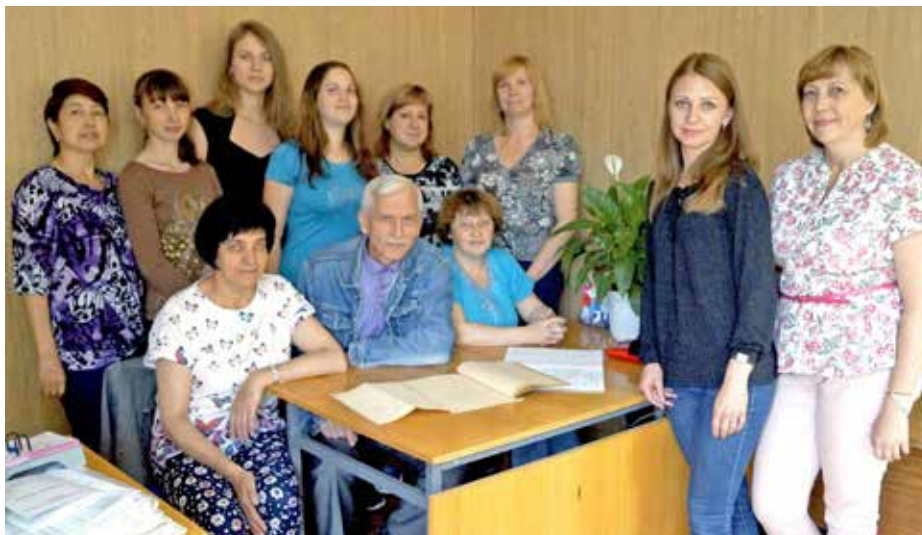
Коллектив отдела автоматизированных систем управления производством

Считает, что за современными информационными технологиями и комплексной автоматизацией завода будущее.