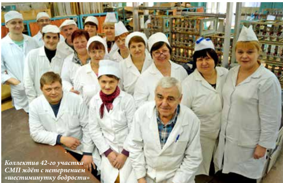
Коллектив 42-го участка СМП ждёт с нетерпением «шестиминутку бодрости»