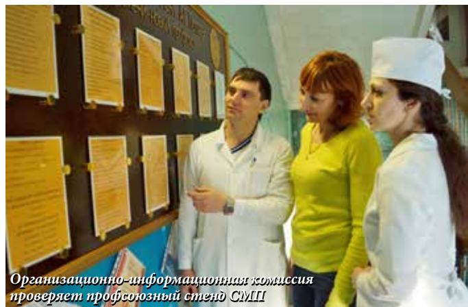
Организационно-информационная комиссия проверяет профсоюзный стенд СМП

Из года в год большой резонанс вызывает вопрос – во всех ли организациях должны быть профгруппы и где здесь разумная грань. Организационно-информационная комиссия определила подразделения, в которых профгруппы необходимо создать (или воссоздать). Критерии: большие организации или организации, разбросанные по территории предприятия. Это СП+СВБ+РСС+ГОиЧС, ОМТС, СМ+ОдиД+ОПРИУИ, ПДО, ЦНИОКР.