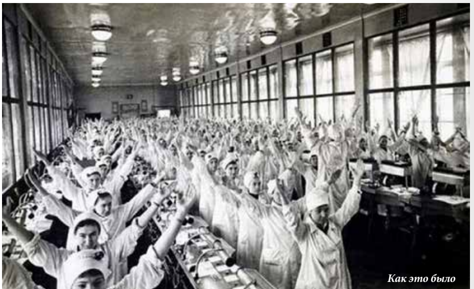
Как это было

Приседания, наклоны, разминка суставов... Много времени это не займёт, и производство от этого не пострадает, только, наоборот, у заводчан поднимется настроение, дух, все охотнее проснутся. Шестиминутные упражнения ежедневно, в определённое время, например, в 11 часов утра и в 15 часов дня по заводскому радио укрепят здо-