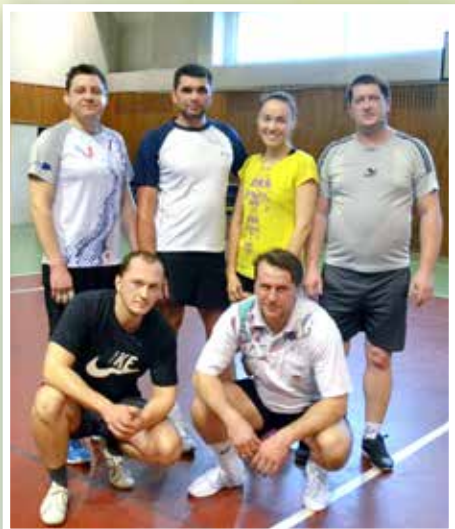
Победители турнира – сборная команда ЦНИОКР

Состязания по волейболу всегда пользовались популярностью у заводчан. Эта командная игра не только сплачивает коллектив, но и выявляет сильнейшие команды подразделений предприятия.