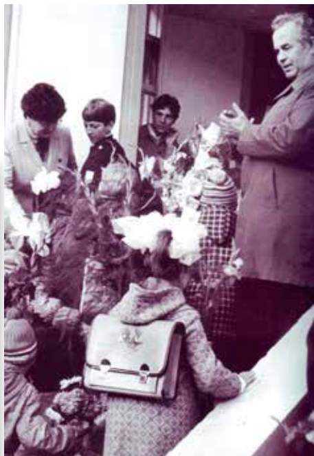
1 сентября 1987 г. – открытие школы № 48