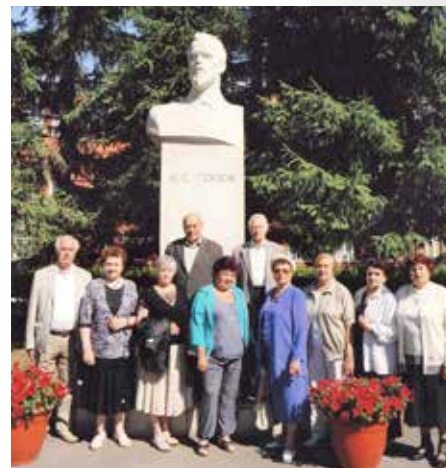
С ветеранами завода у памятника А.С. Попову