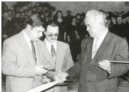
Открытие профилактория «Восход»

Активизировались связи с предприятиями города и соседних регионов, что позволило загрузить производство на основе кооперации. Весной 1992 г. было запущено совместное предприятие с компанией GOLD STAR по производству недорогих телевизоров с маленьким экраном, тем самым завод занял на рынке конкретную, не заполненную на то время нишу.