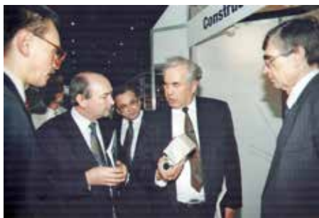
Промышленная выставка в Женеве