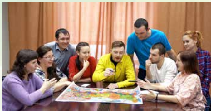
Обсуждая новые маршруты

Если вы хотите стать частью нашего такого разного «Спектра», то в группе клуба в социальной сети «В Контакте» ( vk.com/tk_sprekr ) сможете узнать любую интересующую вас информацию, записаться в поход, поделиться собственными