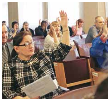
Принимается новое Положение

Напоминаем, что смотр-конкурс-2018 уже в разгаре. Желаем успеха всем, кто к нему стремится!