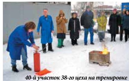
40-й участок 38-го цеха на тренировке

В текущем году хотелось бы отметить хорошую подготовку и серьезное отношение к подобным тренировкам таких подразделений завода, как ОГК, ОТД, МП участок № 33, цех 61, участок № 40 38-го цеха, которые при срабатывании установок автоматической пожарной сигнализации самостоятельно и организованно эвакуировались в обозначенное место на территории