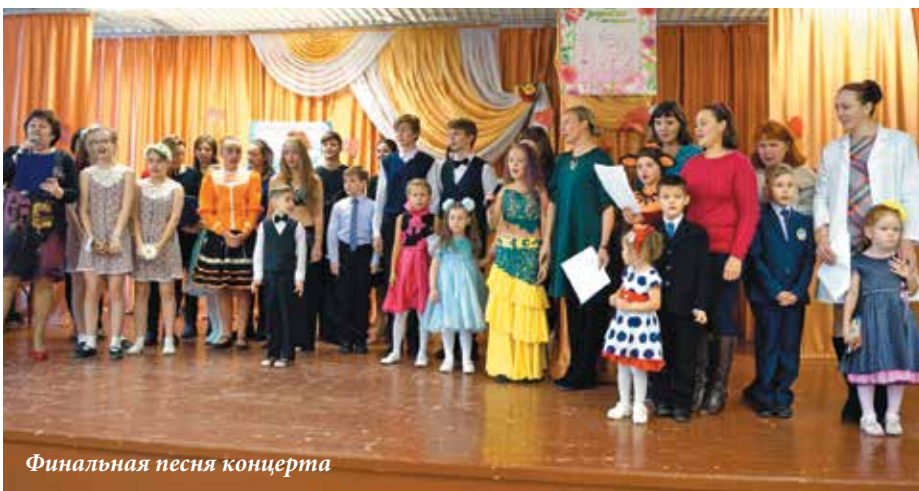
Финальная песня концерта

Хорошее настроение и особая проникновенность любовью к мамам – вот что осталось у всех, кто пришел на это праздничное событие. Спасибо организаторам и, конечно же, нашим маленьким артистам!